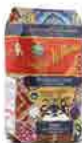
Penne Ziti Lisce