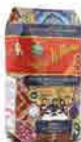
Penne Mezzani Rigate